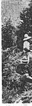
大ガマで下刈りをするひとたち 桑崎高場所

ここ連日、市有林の下刈り作業が勢子辻のひとたちの手で盛んに行なわれています。 下刈りは一年生から八年生までの山林を対象に行うもので、ことしは桑崎高場所、穴小屋などのざつと十一ヘクタール。「一日ひとり二〇アルしかできない」といながらも刃渡り五〇センチの大きなカマで雑草を切り払っていく。作業は九月中旬まで行われます。