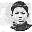
校にうん 野の中学 日、中 う、日 十月三

どう会を見にいつたとき コンクリートのほそい道 をあるいていた、二つく らいの子が、足をふみは ずして、コンクリートの 上におちました。あたま からちがだらだらながれ ていきました。 ぼくはそれを見て、あ んなことがないようにす るには、おかあさんが気 をつけなければいんだ。お かあさんがいっしょにい てやればいいんだと思 いました。 でも、いくらおかあさ んたちが気をつけても、 子どもが気をつけなけれ ば、なんにもなりません だからおとなも、子ど もも みんなが気をつけ ればいいんだと思いまし た。(大淵二小)