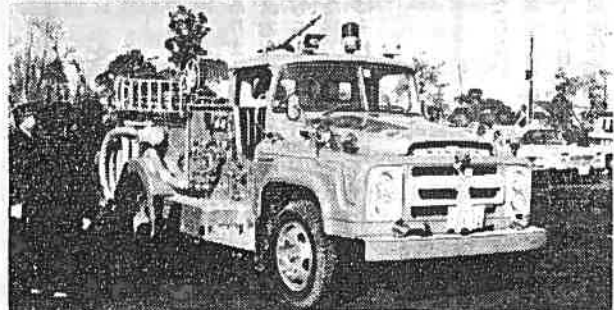
写真は(上)ポンプ操作を披露する団員(下)新しく消防署に配車された最新鋭化学消防車

恒例の吉原市消防団出初式は一月五日、吉原小学校で吉原市長ら消防団関係者五〇〇人が参加しておこなわれました。一分団の小隊訓練、各分