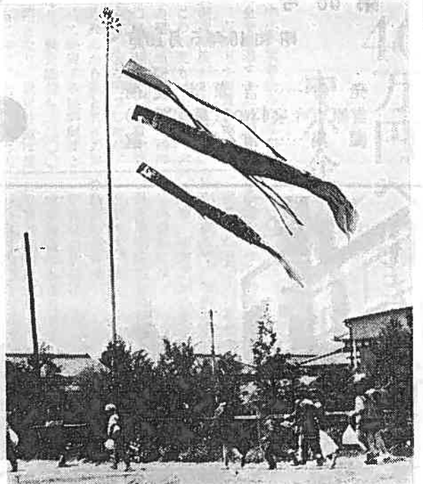
五月の空におどるこいのほりと元気に登校するよい子たち—津田で—