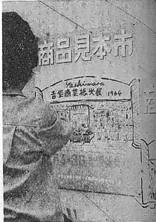
まち角へはられた商品見本市のポスター

ほしいものです。私たちも一生懸命研究努力をします。 展示時間は、午前十時から午後六時までで、入場は無料、参観の結果をアンケートとして記入提出した方には、その場で電機製品などの当る「三角クジ」をたのしんでいただくことになっています。