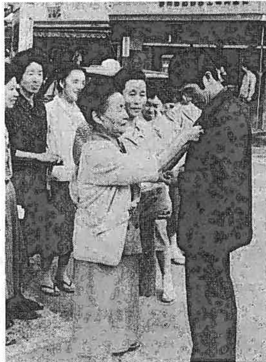
街頭募金に協力する婦人会員

世の中の不幸をなくし、募金運動が今年も十月一日から全国いっせいに展開される。赤い羽根をシンボルとするこの運動も今年で一八回おこなわれる赤い羽根共同募金運動だ。