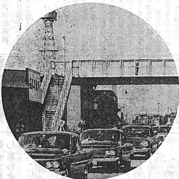
交通安全の願いこめ国道へかかる津田人道橋