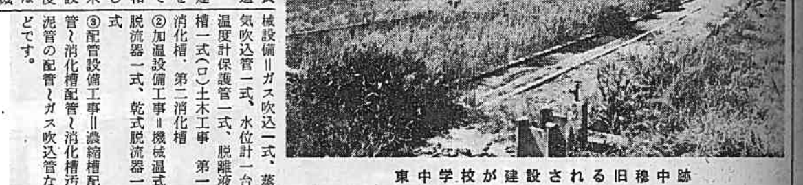
東中学校が建設される旧移中跡

市職員募集 ▽試験期日 とき 11月5日 ところ 市民会館 ○くわしくは市長公室へ ▽資格 昭和40年3月に高 校、短大、大学を卒業す る見込みのもの ▽採用職種 事務職員、技 術職員、消防職員(若干 名) ▽給与 2万円~3万円位 ▽申込み受け付け期限 10月19日まで 市役所市長公室で