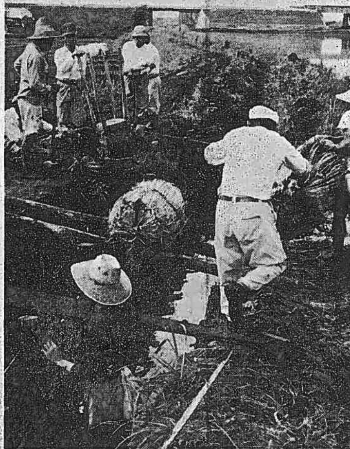
(写真説明) 6月27日の集中豪雨で決壊された土手の復旧作業にあたる人々