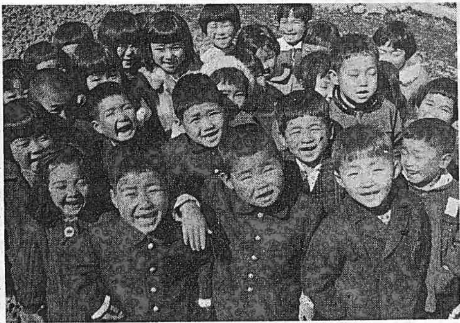
ぼくらみんな一年生 (東小学校にて)

健全財政を堅持するためには、経費削減には優先的な財政措置を講ずる必要がある。このうち、電気料金の引下げは、市民の負担軽減に資するものとして、積極的に取り組むこととした。