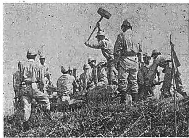
積土俵作業に一生懸命な組合員

出水期を迎え、水防演習が去る八月七日、八日、九日と行なわれました。市民の水防に対する協力と理解を求め、この日は雨水防(仁藤助役)の意気高揚、水防技術の練磨を始め関係者多数が参加、水防長