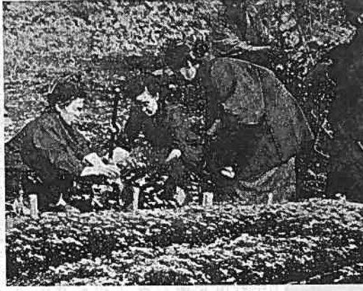
花いっぱい運動に余念のない婦人会員

吉原市が、花いっぱい都市対抗で奨励賞を受賞しました。これは、市民の協力で、市内各所に花を植える活動が行われたためです。 ◆奨励賞の概要 花いっぱい都市対抗は、全国の自治体で行われる活動です。吉原市は、市民の協力で、市内各所に花を植える活動を行い、奨励賞を受賞しました。