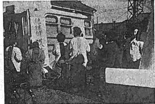
結核健康診断をうけるひとたち

四月から開校する市立商業高校の南校舎は、三月末にほぼ完成しました。校舎は、運動場の南側にあり、面積は約一万平米です。 ◆校舎の概要 南校舎は、二階建ての鉄骨コンクリート造りで、面積は約一万平米です。校舎内には、教室、実習室、図書室などが設けられています。