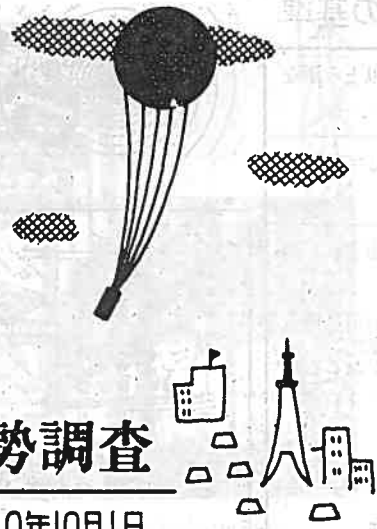
国勢調査 昭和40年10月1日

ことしの10月1日には、全国いっせいに国勢調査が行なわれます。国勢調査は国のものとも基本的な統計調査で市町村ごとに男女、年齢、職業などの人口構成を明らかにするため、5年ごとに行われています。ことしの国勢調査は、大正9年の第1回調査から数えて10回目にあたります。とくに今回の調査では、調査の結果を早く知るために、「光学式読取り装置」という最新型の機械と電子計算機とを使って集計を行なうことになっております。これによつて、前回は40か月かかっていた集計が20か月でできることとなります。各家庭には、9月24日から国勢調査員がおうかがいして調査票への記入をお願いし、10月9日ごろその調査票を集めますので、格段のご協力をお願いします。