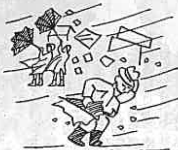
平均風速 30メートル