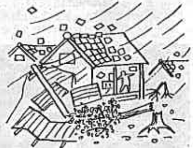
平均風速 27~28メートル