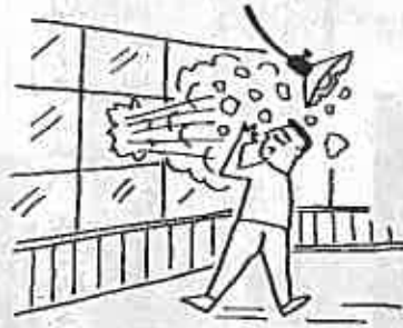
平均風速 25メートル