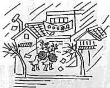
平均風速 20メートル