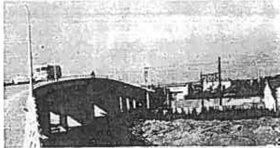
新名所の一つ富士大橋