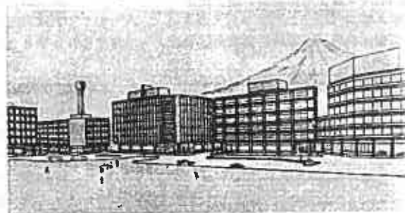
都市改造後の富士駅前