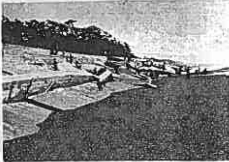
田子浦海岸を襲った15号台風