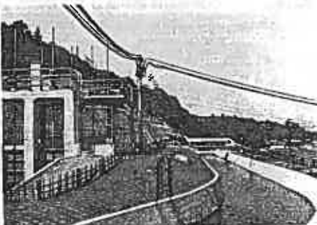
富士川用水の滝戸口