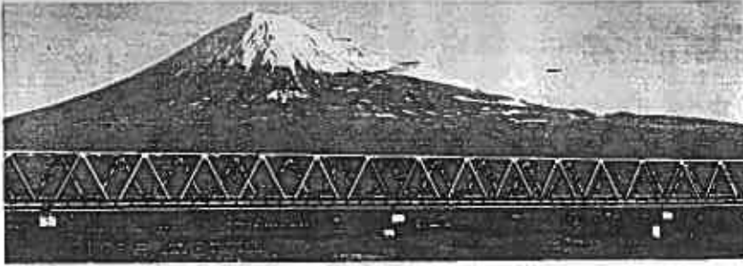
日本一長い新幹線富士川鉄橋

このページは富士市10年のあゆみの中で特記すべき話題を見易くするために写真をもつて集録してみました。