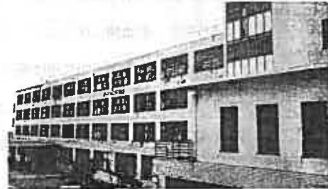
市立富士中央病院