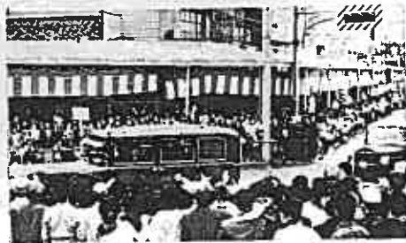
国体ご視察のため両陛下、富士駅へご到着