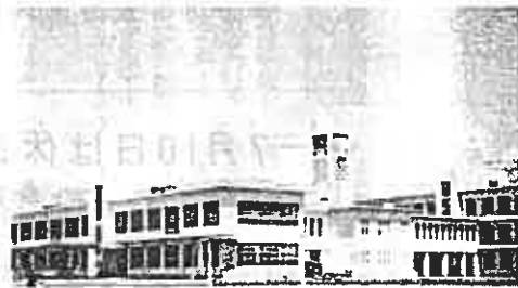
文部省指定モデルスクール富士中学校