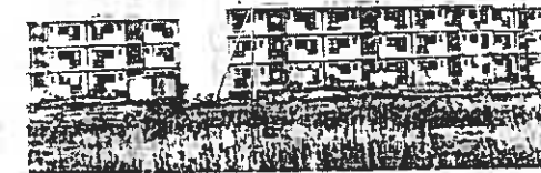
三四軒屋団地の市営住宅