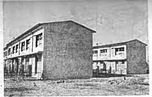
(写真) 宮島団地に完成した市営住宅

民生費 — 住宅行政は、寮跡地は商店街に造成し、その本づくに重点的に取り上げて、財源を民生費に振り向け売却処手。このため市内中島の厚生 分を考えています。