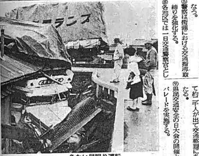
危ない居眠り運転

11日は「県民交通安全の日」 春の交通安全運動は、ことしも五月十一日から二十日まで県下一斉に実施されます。そこで県はさきごろ県警本部など関係機関との関係のある各官公庁ならびに民間団体などと協議し、「県交通安全対策協議会」を発足し五月十一日を「県民交通安全の日」として各種事業をくりひろげ、総合的な交通安全を推進することになりました。 十一日の主な行事はつきのとおりです。 ①労働基準局が各事業所へ交通安全を指導し、交通安全に関する行事を行なう。 ②陸運事務所が車両検査を行なう。 ③建設省は道路橋樑の清掃、新設整備を行なう。 ④教育委員会は、学童の交通安全と早稲の交通安全の強化を行なう。