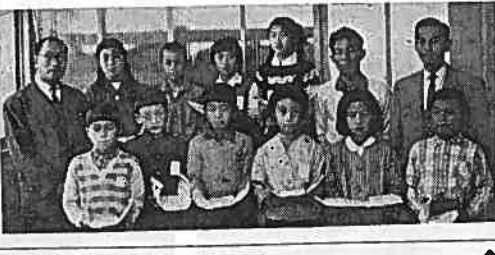
児童画コンクール入賞者(左から)富士一小二年生、岩松小三年生、富士市教育委員会関係者

富士一小と岩松小が、富士市児童画コンクールで入賞しました。 富士一小は、二年生の作品が、岩松小は、三年生の作品が、それぞれに入賞しました。