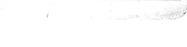
水泳シーズン来る