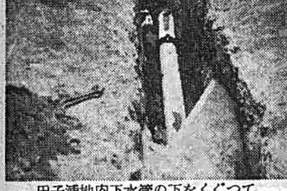
田子浦地内地下水管の下をくぐって配水管布設工事中