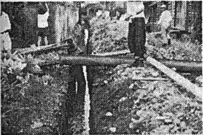
湧水に悩む五味島地内の水道工事

田子浦水源の配水管施設に先立ち、新浜地区の配水管施設に先立ち、四月下旬より着工したこの水源ポンプ場は、浅野物産株式の請負により九月末竣工いたしました。 この建物は写真に見るように鉄筋コンクリート造十九坪の明るくじつぱりとしたものです。この内部には湯沢水源より移設された二〇馬力タービンポンプ及び停電時切替用の三〇馬力ガソリンエンジン各一台、鋼板製径一、八米長四、五米の圧力タンク二基の外正面東側に圧縮空気補充用の三馬力エヤーコンプレッサー、西側に塩素加圧注入用の三馬力渦巻ポンプ各一台あり、更に東側に自動及び手動切替スイッチを備えた配電盤設備されております。 この圧力タンクは常時所定の圧力を与え且ポンプの断続運転により、ポンプに休養を与えその寿命を延ばし併せて電力の軽減を図