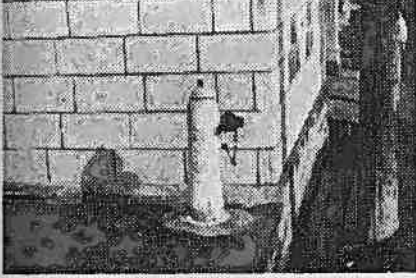
地元民の協力によりホッと安心した消火栓(川原宿地内)